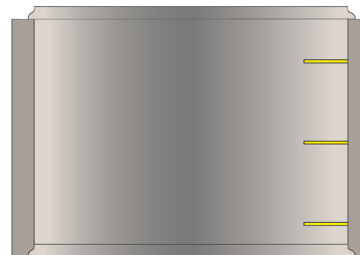
Éléments droits H900 3 échelons