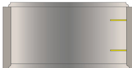
Éléments droits H600 2 échelons